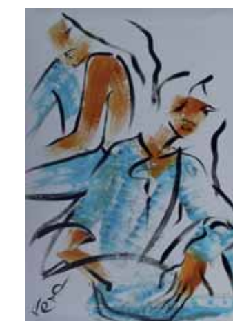
Serie « BLUE MOTION » I Acryl en PVC 80 x 120 cm