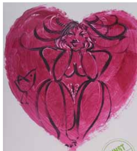
ONE FOR THE HEART Acryl en PVC 80 x 120 cm

El poliéster es un material resistente al agua y al las inclemencias del tiempo, así como también a los rayos ultravioletas del sol, a los cambios de temperatura y de humedad. El acabado de su superficie es extraordinariamente liso, lo que facilita la aplicación y el mantenimiento de los colores. Especialmente recomendable para presentaciones al aire libre.