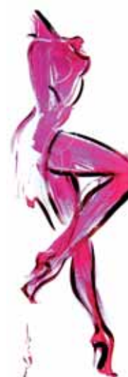
Serie "PINK" IV Acryl en PVC 50 x 150 cm