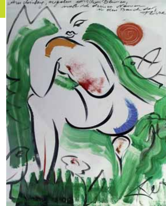
SPRING Acryl en PVC 80 x 110 cm