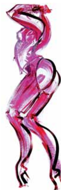
Serie "PINK" II Acryl en PVC 50 x 150 cm