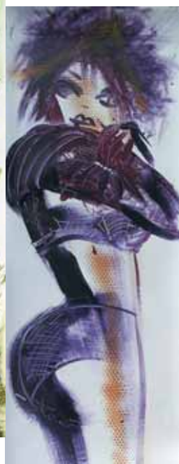
POWER POINT Acryl en PVC 50 x 150 cm