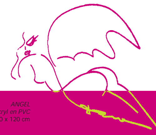
ANGEL Acryl en PVC 120 x 120 cm