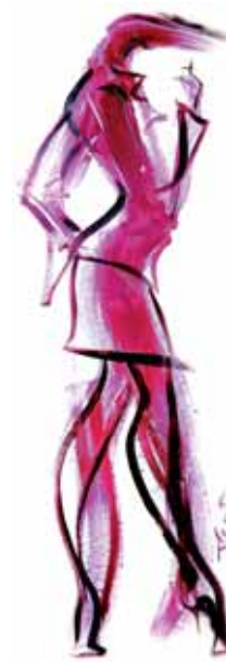
Serie « PINK » I Acryl en PVC 50 x 150 cm