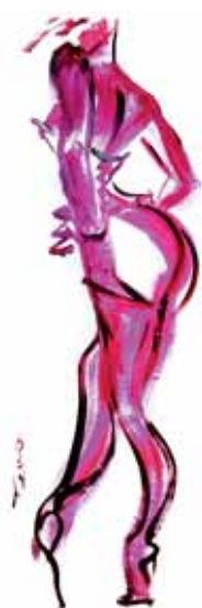
Serie "PINK" III Acryl en PVC 50 x 150 cm