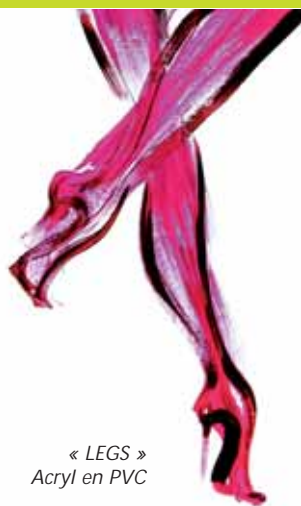
« LEGS » Acryl en PVC