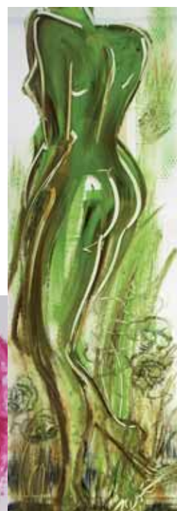
GREEN PIECE Acryl en PVC 50 x 150 cm

“ Quiero expresar la alegría de vivir y el gusto por los colores intensos y las formas por medio de líneas rápidas y vigorosas, atrapar en mis cuadros fantasías eróticas cotidianas, perfilar una mujer libre y segura de sí misma con un guiño travieso jugando con las emociones del observador.”