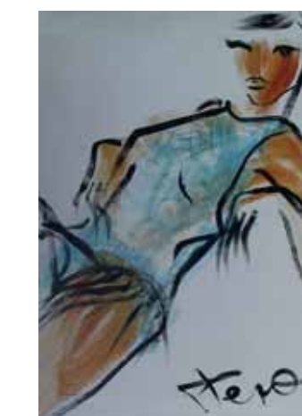
Serie "BLUE MOTION" Acryl en PVC 80 x 120 cm

El poliéster es un material resistente al agua y al las inclemencias del tiempo, así como también a los rayos ultravioletas del sol, a los cambios de temperatura y de humedad. El acabado de su superficie es extraordinariamente liso, lo que facilita la aplicación y el mantenimiento de los colores. Especialmente recomendable para presentaciones al aire libre.