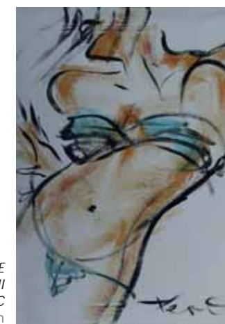
Serie "BLUE MOTION" II Acryl en PVC 80 x 120 cm