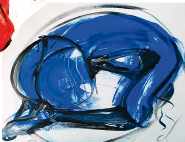
rebirthing, 100 x 80 cm