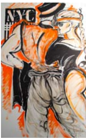
NYC, 120 x 180 cm