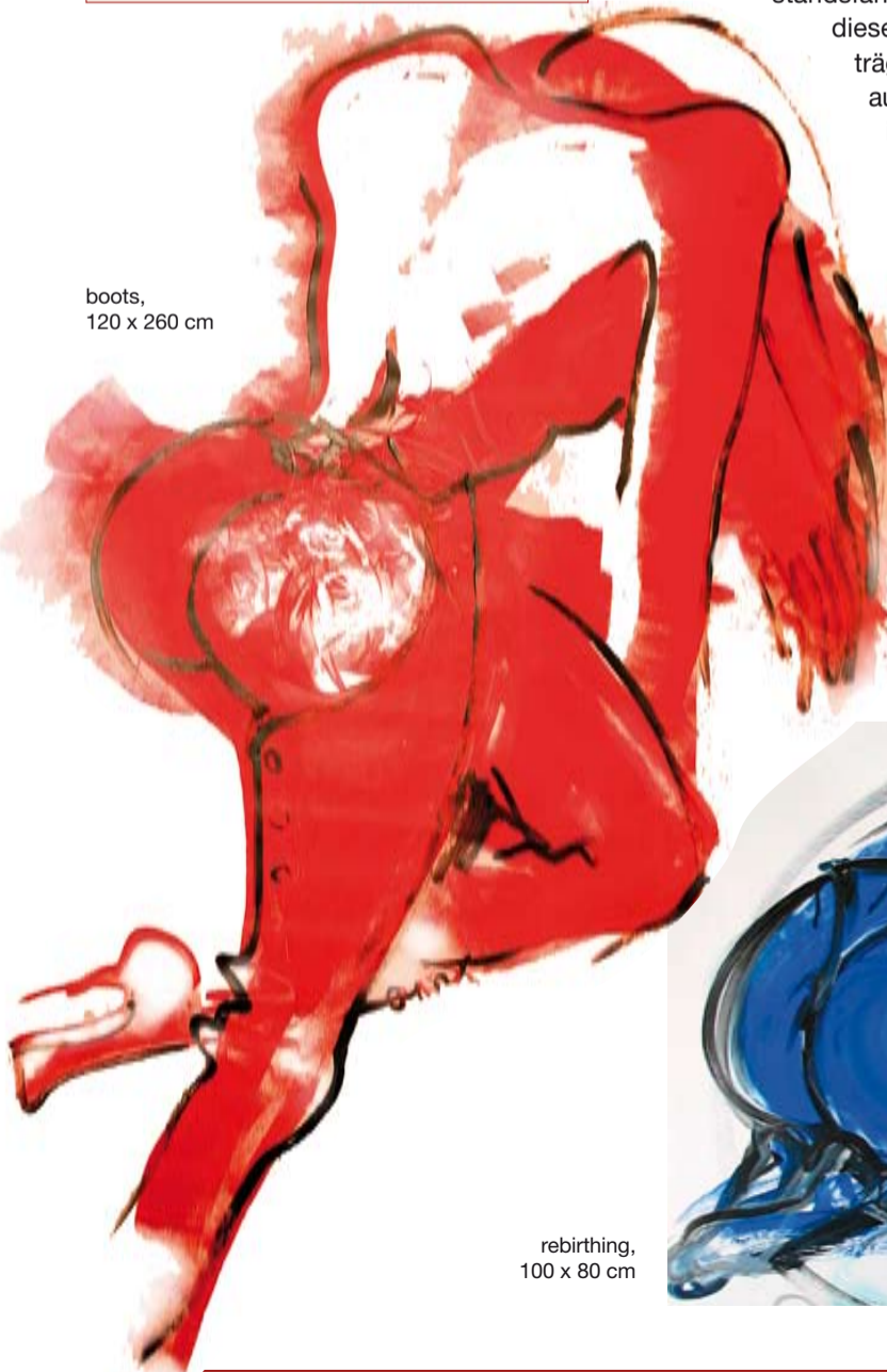
boots, 120 x 260 cm